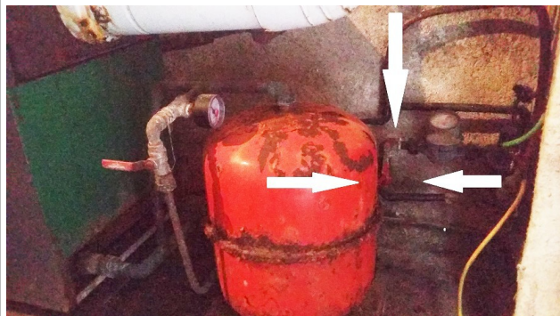
Huvudkran vatten i källaren. Vertikal riktning är på o horisontell är av!